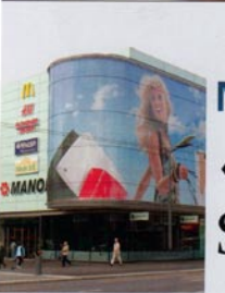
LES VRAIES RAISONS Ou comment Fotalab